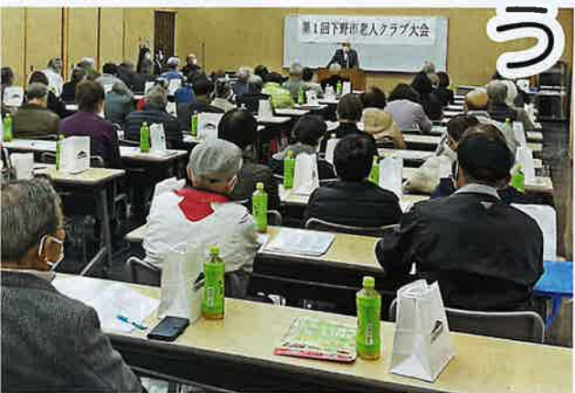
各クラブから多数ご参加いただきました

また、第2部の研修では、クラブ活動の充実と活性化を図ることを目的として、二つの講話を聴きました。