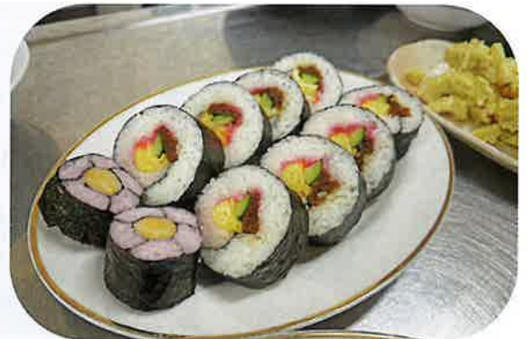
かわいらしくできました!