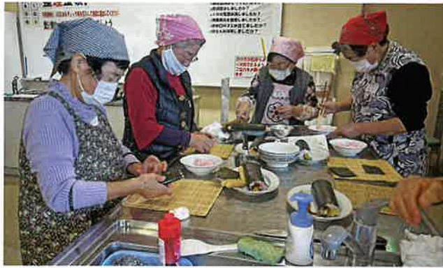
チームで協力して作ります

11月14日(木)、ゆうゆう館の調理室にて女性部交流会が開催されました。 今回は、華やかな模様が楽しめる飾り海苔巻きに挑戦。出来上がりを想像しながら、一生懸命巻いて、その美しい見た目に歓声が上がりました。