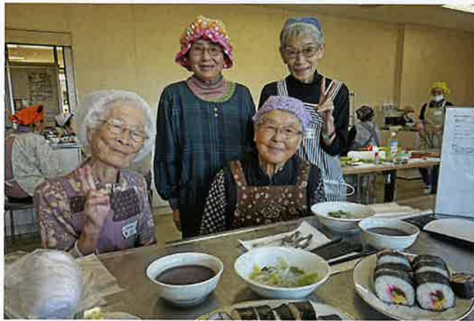
美味しい料理と最高の笑顔

また、なめらかな口当たりの水羊羹も手作りし、伝統の和菓子を味わいながら和やかな時間を過ごしました。 仲間と一緒に何かに取り組むと、心が一つになるものです。来年も皆さまのご参加をお待ちしております。