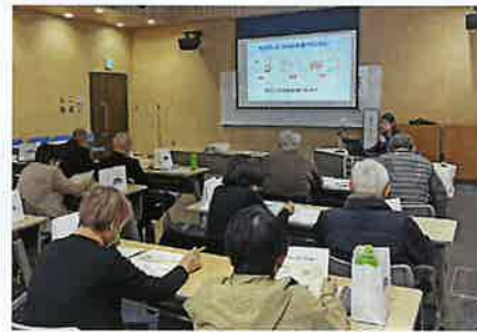
管理栄養士による講話