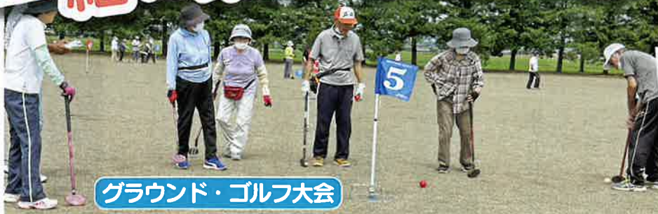
グラウンド・ゴルフ大会