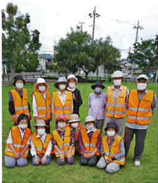
草むしりで芝をキレイに

旬に花壇に植えた花を延べ50人ほどが参加して育成管理しています。また市主催のスポーツ大会には全種目参加。男性会員の協力が少ないなかで、幸運にも輪投げ大会では2年連続で優勝することができました。