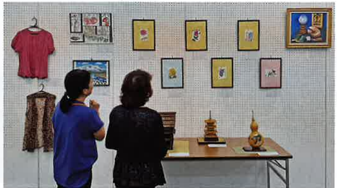
来場者もじっくり見入っていました