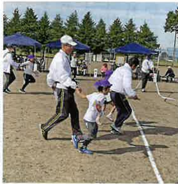
園児と力を合わせてゴール!

輪投げ、綱引き、借り物競争など、多彩な競技が用意され、参加者は元氣いっぱい競技を楽しみました。