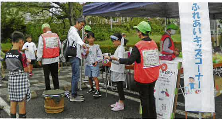
夢中になる子どもたち

10月5日(土)、保健福祉センターゆうゆう館にて「しもつけふくしフェスタ」が開催されました。市老連はふれあいキッズコーナーで昔遊び体験を担当し、輪投げやけん玉など子どもたちと一緒に楽しみました。