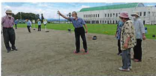
ビュットにとどけ!

7月18日(木)南河内球場にて、ペタンク大会が開催され、7クラブから37名が参加し、技術と知略の競技に臨みました。真夏の暑さに負けない熱気の中、選手のみなさんは素晴らしいプレーの連発で大会を盛り上げました。優勝したグリーンクラブは2年連続の優勝で県大会出場権を獲得。県大会では8位と健闘しました。