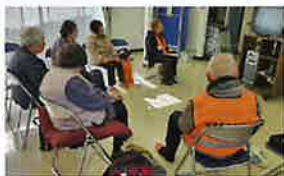
カラオケは元気が出ます