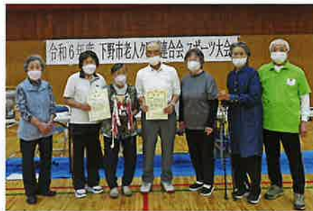
優勝した薬師寺一丁目老人会のみなさん