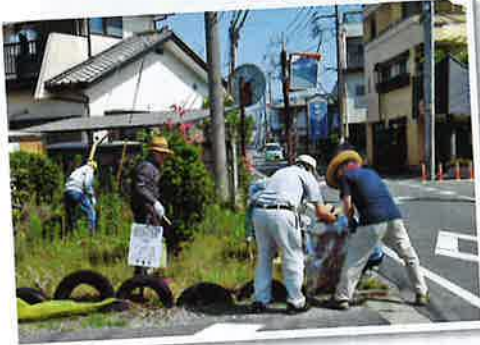
石橋上町なごみの会