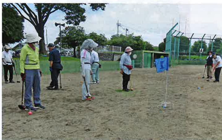
一打一打が真剣勝負

名が参加して、グラウンドゴルフ大会が開催されました。今大会ではホールインワン賞を29名(うち3名は2回達成)が受賞し、素晴らしい結果でした。優勝した仁良川高砂クラブAは県大会でも10位と健闘しました。