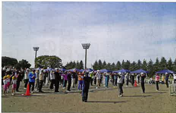
準備体操でけが防止

令和6年10月31日(木)国分寺運動公園グラウンドにて、ふれあいふくし運動会が開催されました。 主催者代表のあいさつの後、来賓の方々から激励のお言葉をいただき、全員で準備体操を行って競技がスタート。プロگرامムにはパン食い競争、玉入れ、