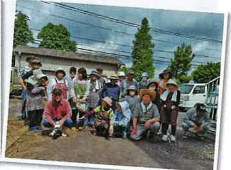
若林北老人会若北クラブ