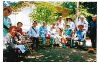
和やかに楽しいひととき