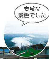
素敵な景色でした

参加者から「楽しかったよ!」とお声をいただき、実施して良かった!と心から安堵した二日間の旅でした。