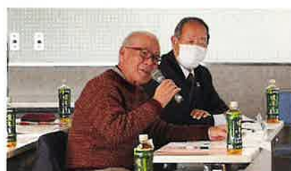
沢山の質問が飛び交いました