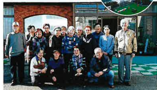
旅館前で集合写真