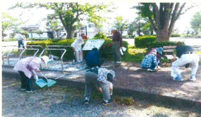
清掃作業のようす