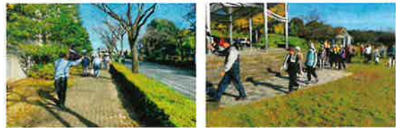
和気あいあい楽しみながら歩きます

また、豊郷中央小学校1年生の児童を対象に昔遊びの伝承ボランティア活動をしています。33名の会員が講師として、幼少時代に楽しんだ「コマ回し」「お手玉」「けん玉」「紙ひこうき」「おはじき」「あやとり」「おりがみ」「だるま落とし」「めんこ」計9種目を、1種目につき20分間として3回実施します。疲労でヘトヘトになりながらも清々しい気持ちになり、子供たちから若いパワーをもらい、楽しいひとときとなりました。