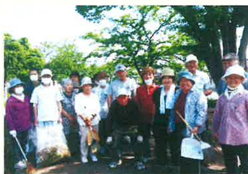
清掃活動後の笑顔が最高!

しています。今のところは協力してくれる会員が多いこともあって、作業に要する時間は各日ともに約1時間から2時間程度であるため負担には感じませんが、季節の変わり目となる残暑の厳しい時期においては、草木の成長も早まることから体力を消耗するため、作業方法等において検討する時期なのではないかと思うところですが、地域貢献活動にも繋がるため今後も継続して実施していきたいです。