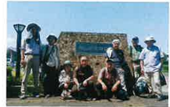
飛山城址公園前で集合写真

今後も、自らの健康寿命延伸を含めて、いつまでも生き活とした活動ができるよう、会員一同頑張っております。