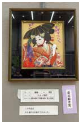
【最高齢者賞】 陶工芸_家紋