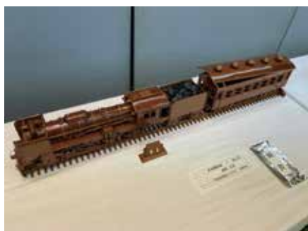
【銀賞】 陶工芸_木製機関車