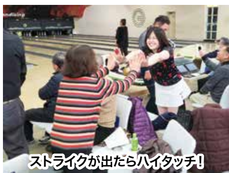
ストライクが出たらハイタッチ!