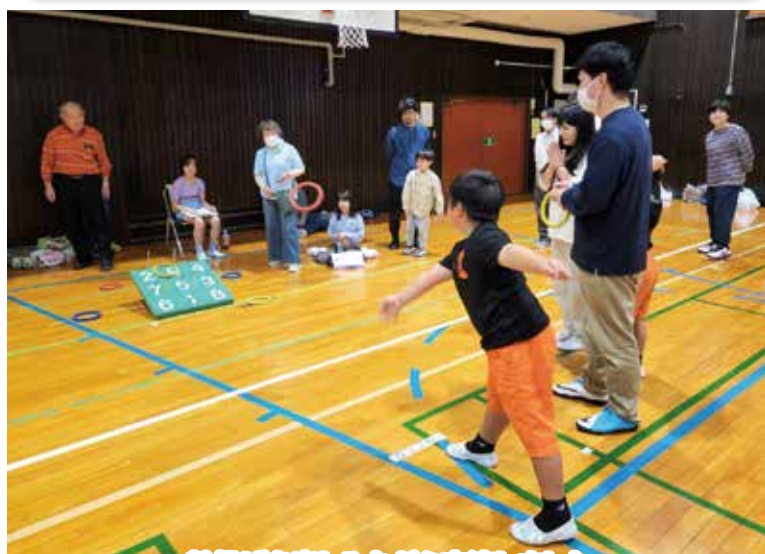
輪投げを楽しみながら交流しました