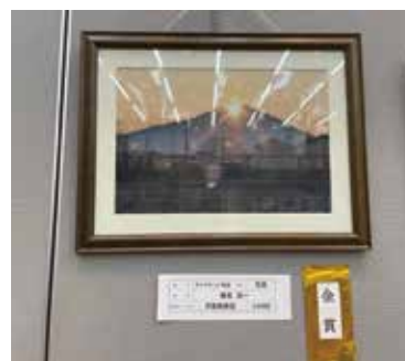
【金賞】 写真_ダイヤモンド筑波