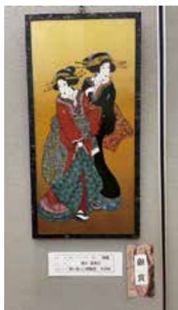
【銀賞】 絵画_浮世絵 (トールペイント、アクリル)