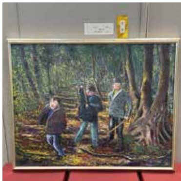
【金賞】 絵画_森の中へ