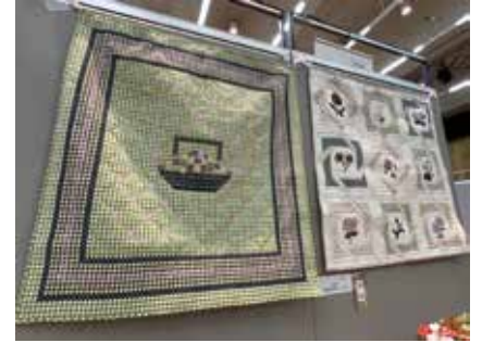
【銀賞】 手芸_アップリケとギンガムステッチの タペストリーセット