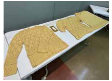
【金賞】 手芸_手編みニット