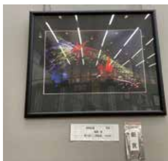
【銀賞】 写真_老樹紅賑