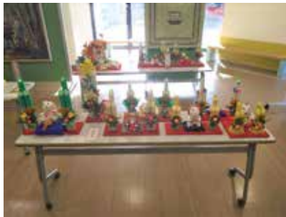
【優秀団体賞】 横倉長寿会手芸部