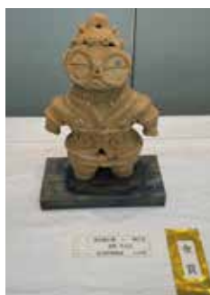
【金賞】 陶工芸_遮光器土偶