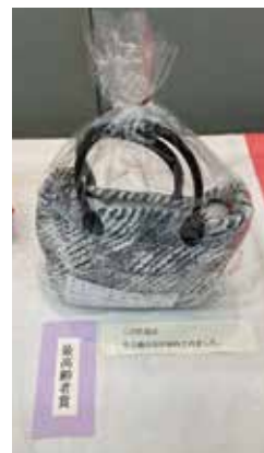
【最高齢者賞】 陶工芸_家紋