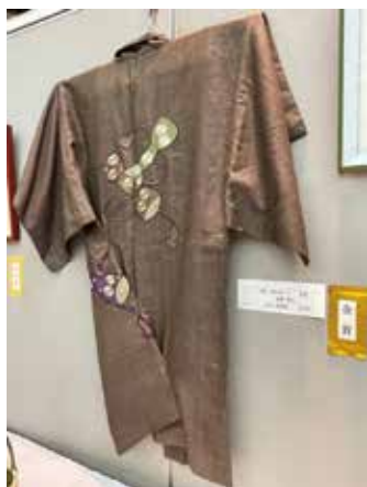
【金賞】 手芸_羽織(一部手芸)