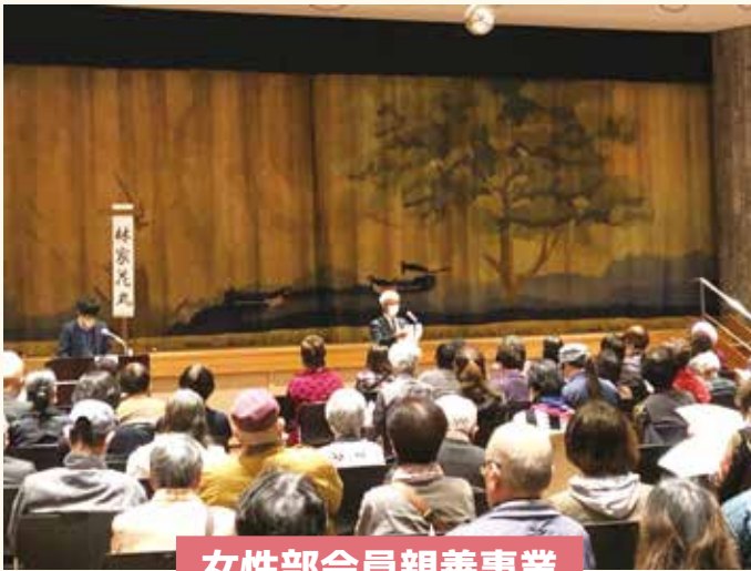
女性部会員親善事業