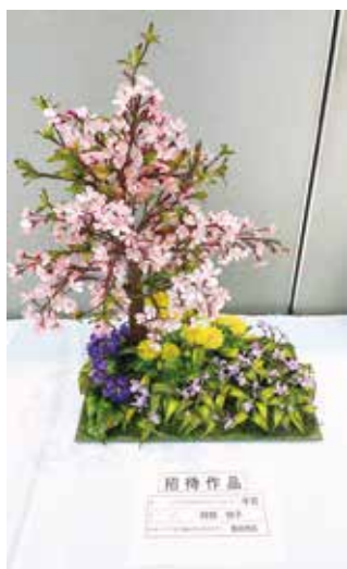
【招待作品】 手芸_アメリカンフラワー