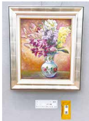
【金賞】 絵画_白い花びんと花たち