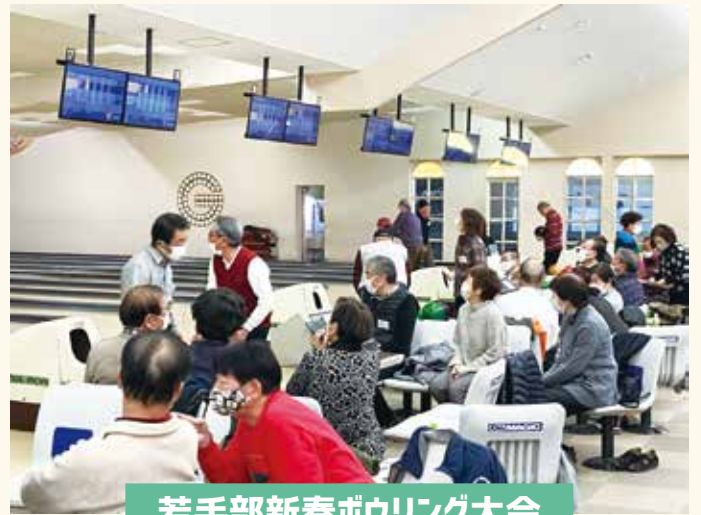
若手部新春ボウリング大会