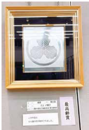
【最高齢賞】 陶芸_家紋