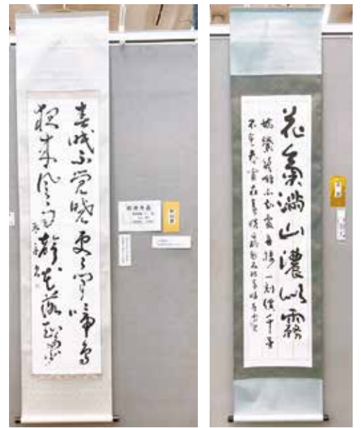
【特別賞・招待作品】