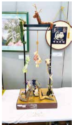
【優秀団体賞】 団体_昇り龍