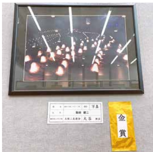
【金賞】 写真_湯西川温泉「かまくら祭」