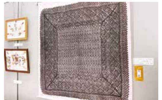
【金賞】手芸_ストール