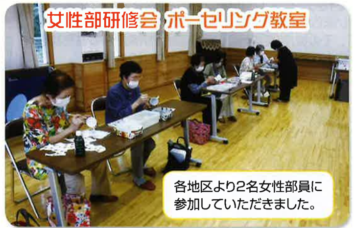
女性部研修会 ポーセリング教室