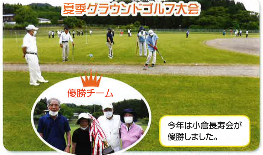
夏季グラウンドゴルフ大会

各単位クラブにおいてもグラウンドゴルフ、ちょきんアップ体操や定期的な健康教室、また、小学校へのボランティアや、社会奉仕活動など様々な分野で活躍しています。新規会員も募集していますので是非、一緒に楽しく「長寿」を満喫しましょう。