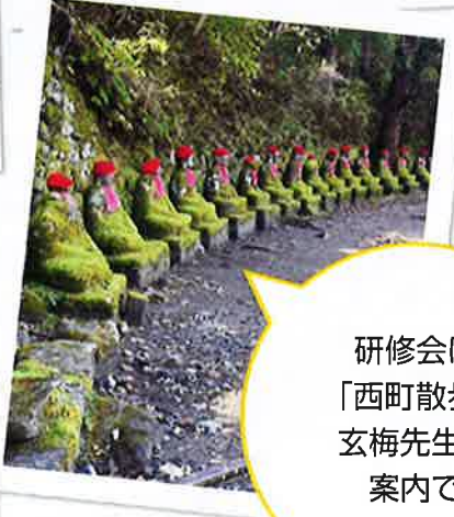
研修会は 「西町散歩」 玄梅先生の 案内で