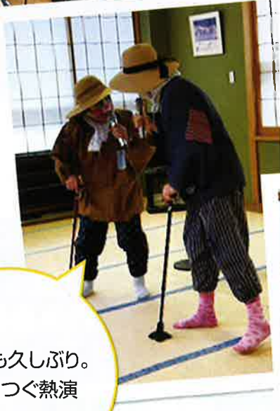
交流会も久しぶり。 熱演につぐ熱演