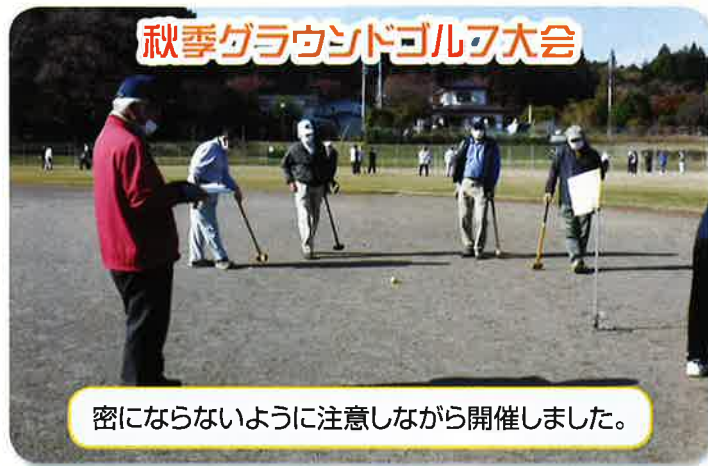
秋季グラウンドゴルフ大会