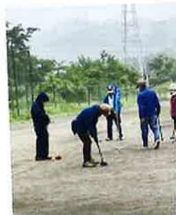
ペタンク・輪投げ・グラウンドゴルフ