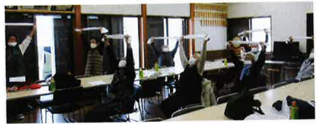
ポッチャ、スカットボール、健康体操など行いました。これからも、新しいことにチャレンジしたいです。