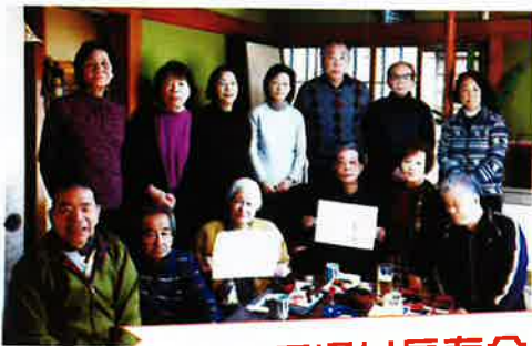
さくら通り長寿会

さくら通り長寿会は、鬼怒川温泉街地区にあり、昭和45年に設立されました。現在は男性と女性の比率が半々の比較的若い年齢層で構成されています。令和4年度の活動は“ふれあい橋公園”の清掃奉仕や高齢者向け教養講座等を計画していましたが、新型コロナの影響から