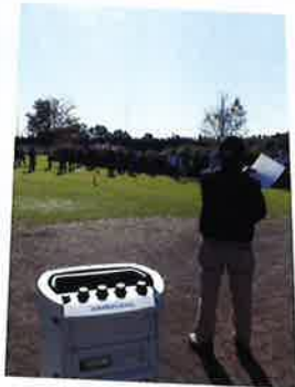
秋季グラウンドゴルフ大会

今回のテーマは「美味しく食べてフレイル予防！お家でできる簡単体操！！」です。日光市健康課職員をお招きし、各家庭で食べているみそ汁の塩分濃度を測定し食事の大切さや、簡単な体操などを教えていただきました。