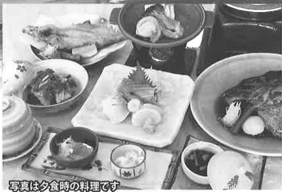
写真は夕食時の料理です