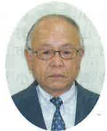
栃木いきいきクラブ