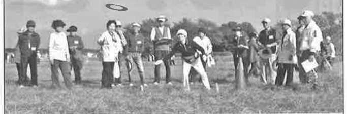
〈スカイクロス大会風景〉