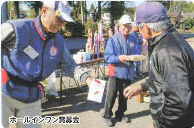
ホールインワン賞募金

各単位クラブでは、グラウンド・ゴルフ練習や定例会等を小規模で実施しています。そこで、感染防止対策チラシと手指消毒アルコールを配布し予防策をとりました。次に会員全員に会活動を周知するため、会報第一号を発行しました。「読んだよ」「総会の代わりになったよ」との意見もあり安堵しました。大人気のグラウンド・ゴルフと輪投げ大会をやっと11月に開催。感染防止を意識し輪投げ会場を屋外にしましたが、早朝から落ち葉掃き等グラウンド整備をする会員