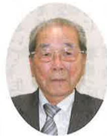
栃木いきいきクラブ (一財) 栃木県老人クラブ連合会