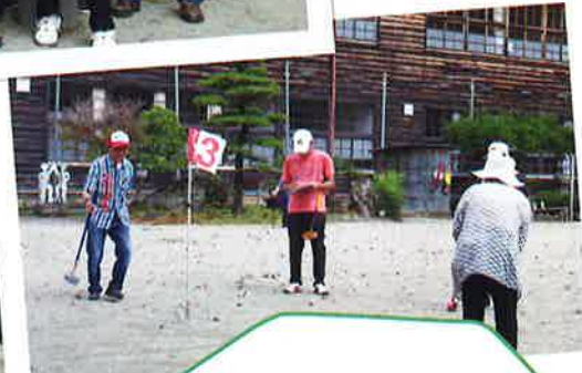
須賀川下 いきいきクラブ 県スポーツ大会にて