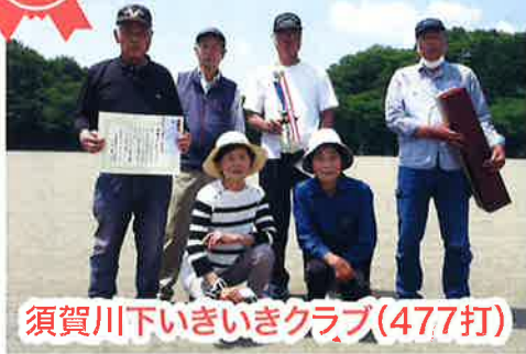
須賀川下いきいきクラブ(477打)