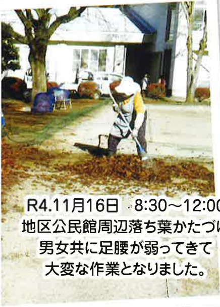
R4.11月16日 8:30~12:00 地区公民館周辺落ち葉かたづけ 男女共に足腰が弱ってきて 大変な作業となりました。