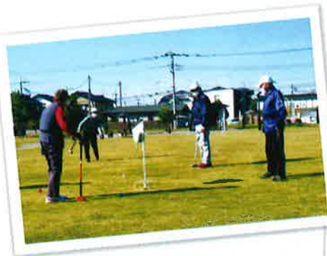
富士見ハイツいきいきクラブ