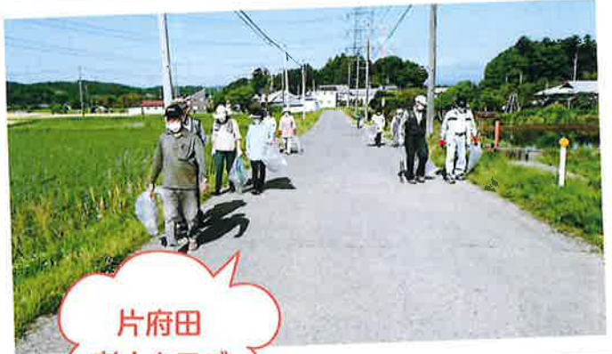
片府田 老人クラブ