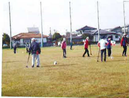
秋季グラウンドゴルフ大会