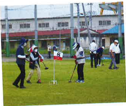
春季グラウンドゴルフ大会