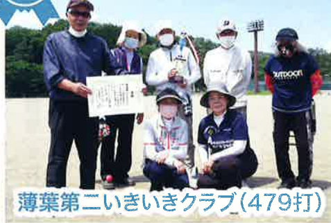
薄葉第二いきいきクラブ(479打)