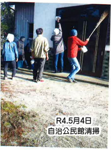
R4.5月4日 自治公民館清掃