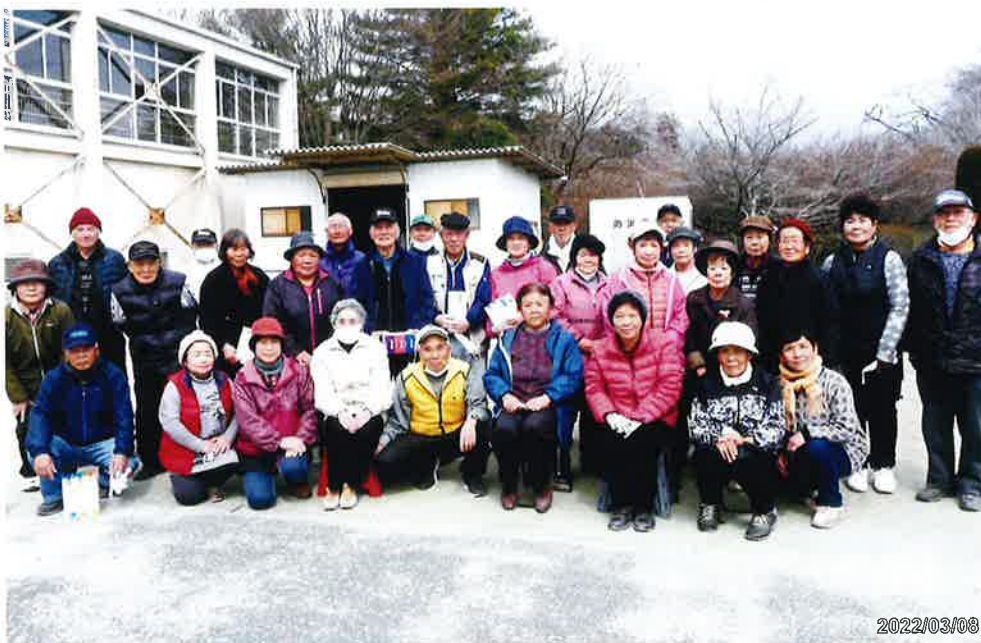
金田南地区 第5回ペタンク交流大会参加者