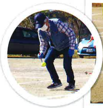
野崎地区スポーツフェスティバル