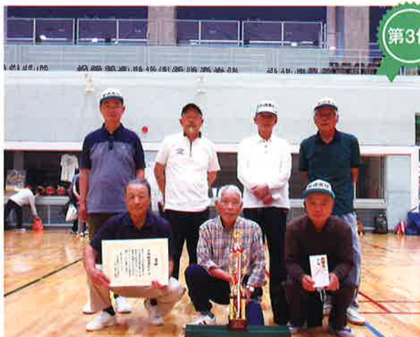
野崎東町自治会長寿会(511点)