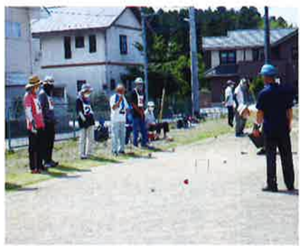
月例ゲートボール大会