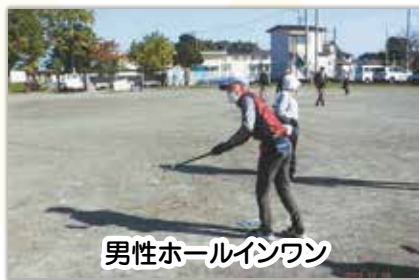
男性ホールインワン