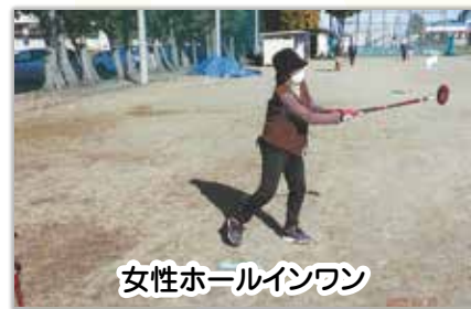
女性ホールインワン