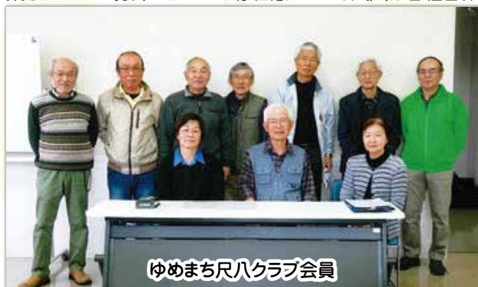
ゆめまち尺八クラブ会員

まず尺八について、どんな楽器か?を簡単に紹介する。尺八は日本古来の楽器で江戸時代中期に開発されている。尺八の音量は決して大きくない。むしろ小さいのですが、一つの音に幅があり、神秘的に鳴り響く。たくさんの音が重なり合って構築されている現代においても存在感がある。尺八は音程自体