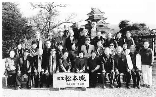
文化薫るアルプスの城下まち 国宝松本城 2016年11月30日

福祉バスを利用させていただき有り難うございました。大変有意義な2日間の研修旅行でした。