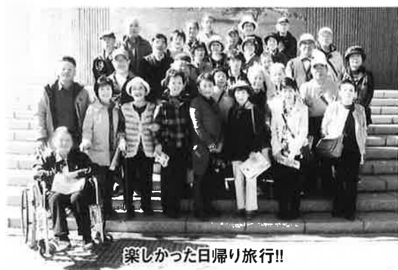
楽しかった日帰り旅行!!

会員数の増加 を目指すため にも魅力ある活 動を心がけなが ら「明るく、楽し く、元氣よく」を モットーとして、 今年度は会員の 皆さんの創意の もとで多種多様な 活動を実践して おります。