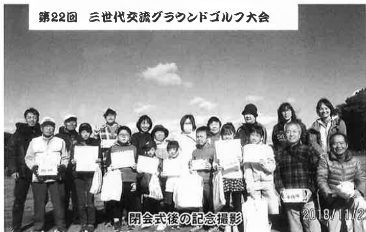
閉会式後の記念撮影 2018/11/2