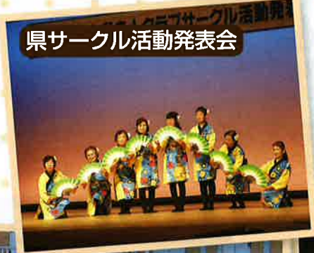
県サークル活動発表会