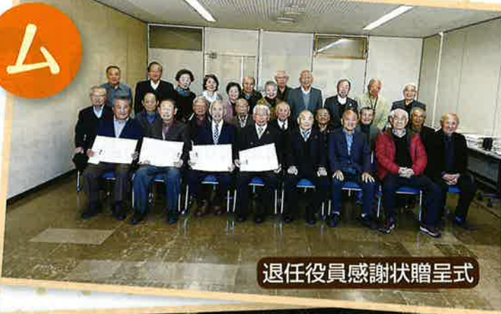
退任役員感謝状贈呈式