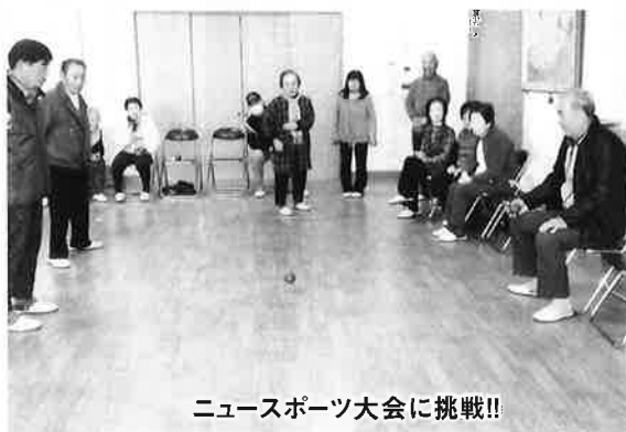
ニュースポーツ大会に挑戦!!