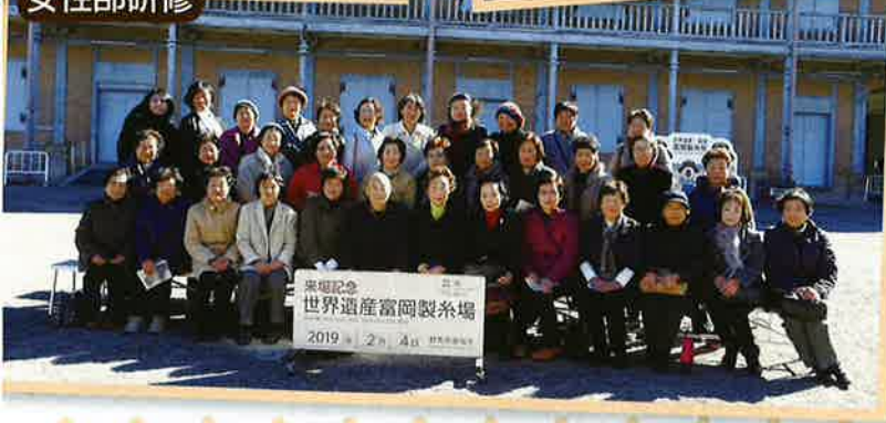
栗垣記念 世界遺産富岡製糸場 2019.2月4日