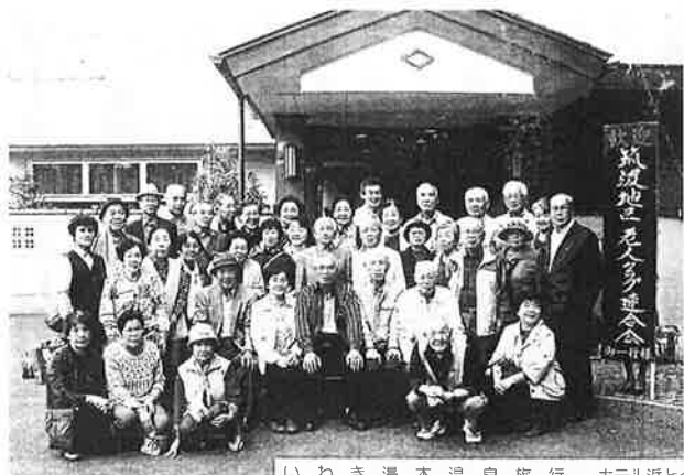
いわき湯本温泉旅行 市北近レ

初日「野口英世記念館」を見学し、温泉に一泊、宴会は予想以上に盛り上がった。翌日は国宝の願成寺「白水阿彌陀堂」を参拝し、海産物店で買い物三昧となった。車中では「命をありがとう」を合唱し、ピョンゲームで楽しみ、今後の活動にも話に花が咲いた。