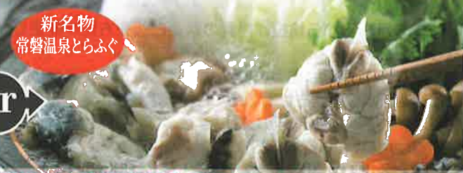
新名物 常磐温泉とらふぐ