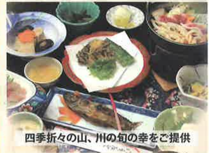
四季折々の山、川の旬の幸をご提供

4月～6月アフターディスティネーションキャンペーン期間中、特別企画として1日2時間人工芝グランド使用料サービス致します。(旅館側で負担致します)