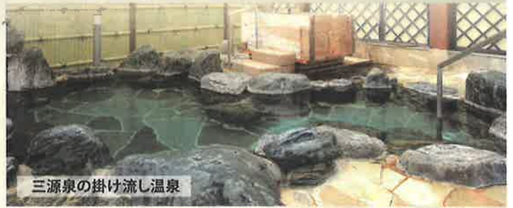
三源泉の掛け流し温泉