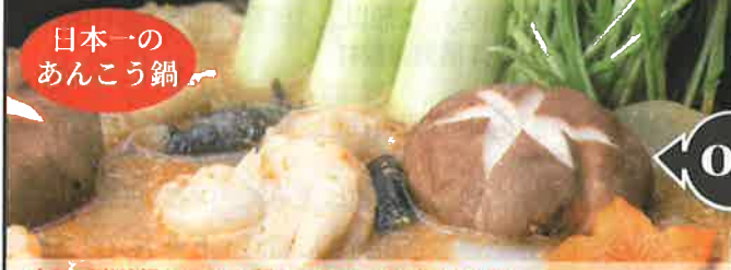
日本一のおんこう鍋