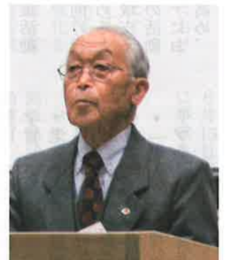
東原会長あいさつ

平成30年度の市町老連リーダー研修会が、2月18日(月)「とちぎ健康の森」講堂において開催され、県内各市町老連から役員等約270名が参加しました。