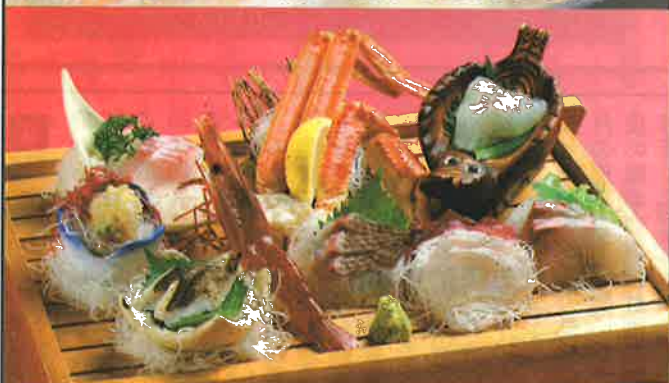
港直送の海鮮料理

新鮮直送！自社で温泉を使って蒸しています。 あっさりホクホクの常磐温泉とらふぐ鍋