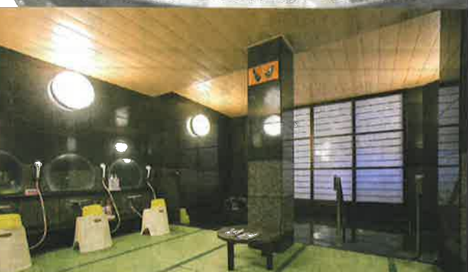
身も心もゆったり寛ぐ畳敷きのお風呂