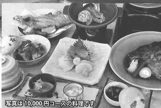
写真は10,000円コースの料理です