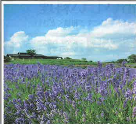
信州国際音楽村ラベンダー祭り・6月下旬～7月中旬