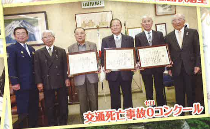
交通死亡事故0コンクール