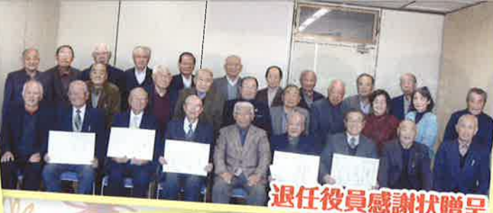
退任役員感謝状贈呈