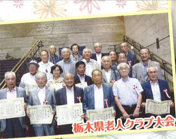
栃木県老人クラブ大会