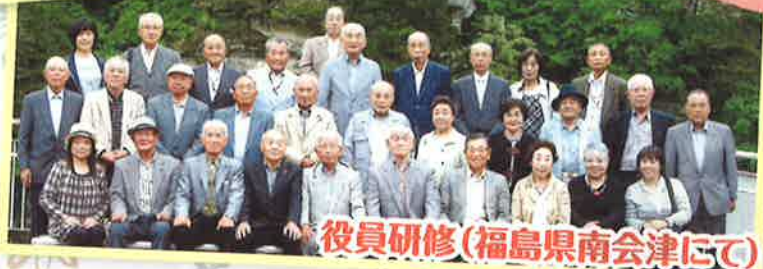
役員研修(福島県南会津にて)