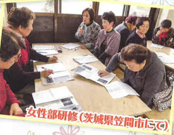
女性部研修(茨城県笠間市にて)